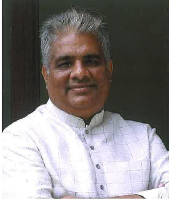
श्री भूपेंद्र यादव

माननीय मंत्री, पर्यावरण, वन एवं जलवायु परिवर्तन मंत्रालय